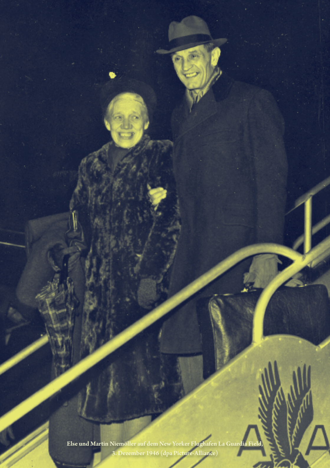
Else und Martin Niemöller auf dem New Yorker Flughafen La Guardia Field, 3. Dezember 1946