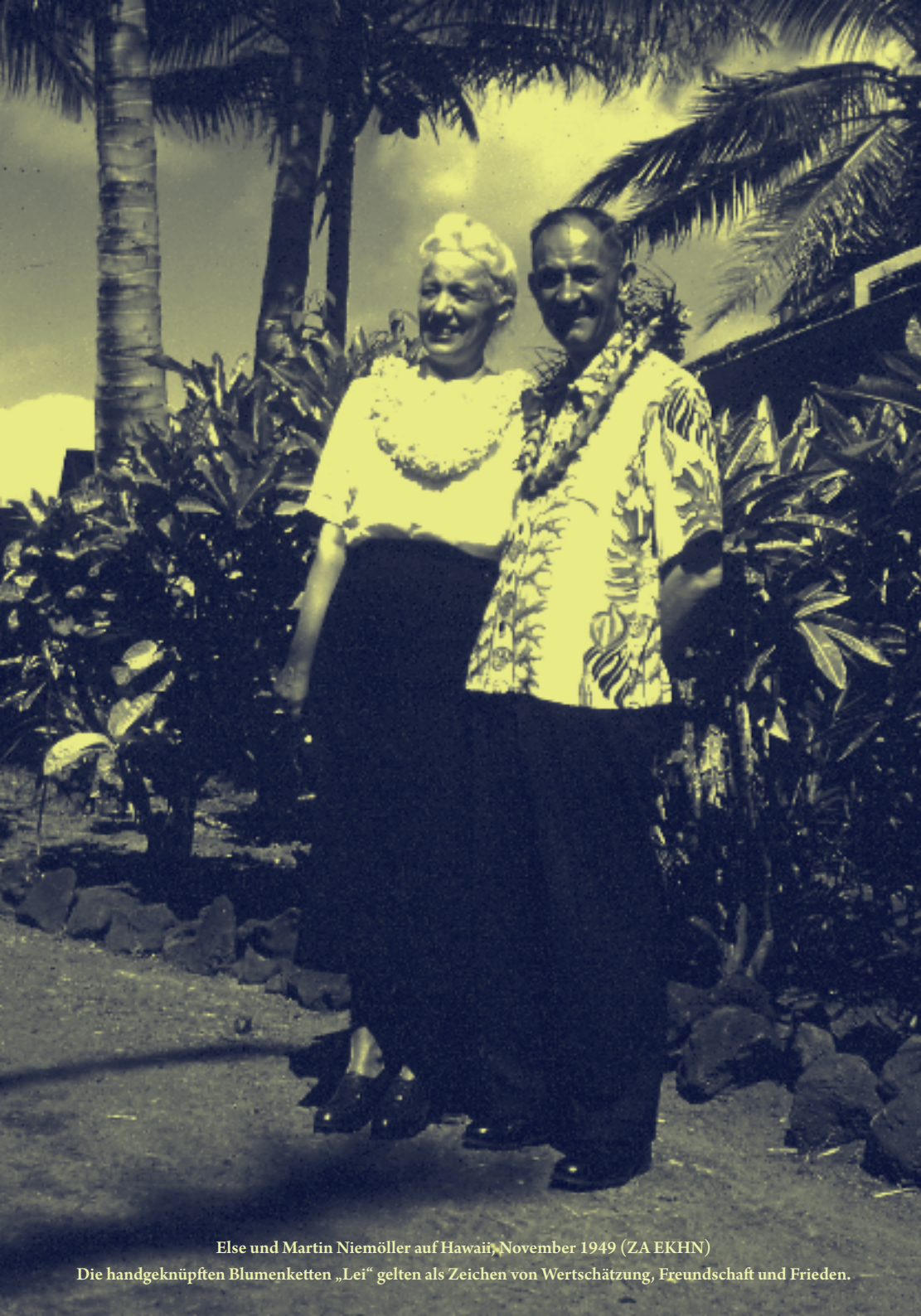
Else und Martin Niemöller auf Hawaii, November 1949