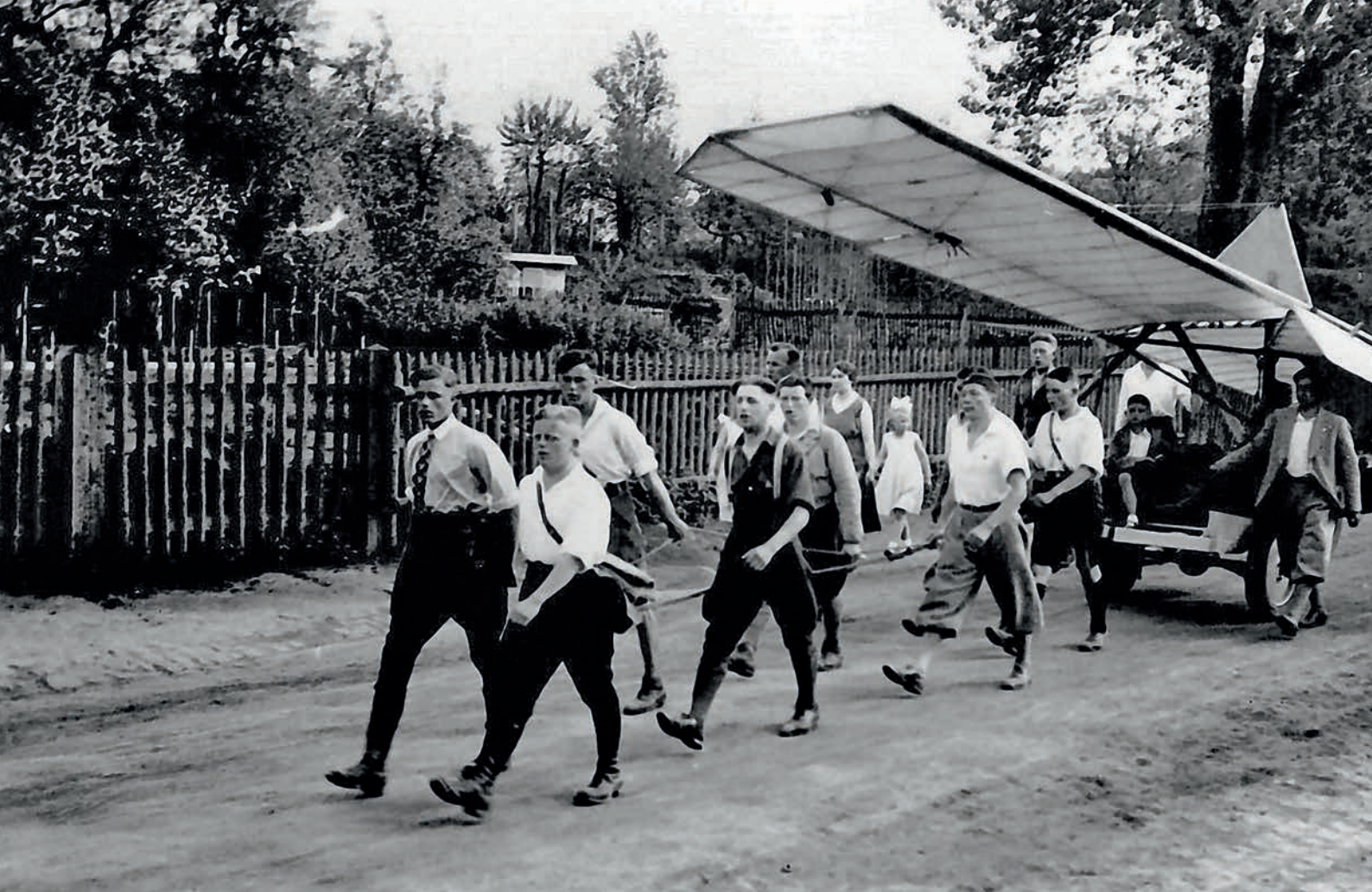
In den 20er Jahren zogen die Studenten das Fluggerät mit eigener Muskelkraft zum Startplatz bei Cyriaxweimar (oben). Dank neuer Technik nutzte die Uni später auch die Afföller Wiesen nördlich von Marburg zum Segelflug; im Jahre 1936 weihte sie hier ihre neuen Flugzeuge ein (unten).