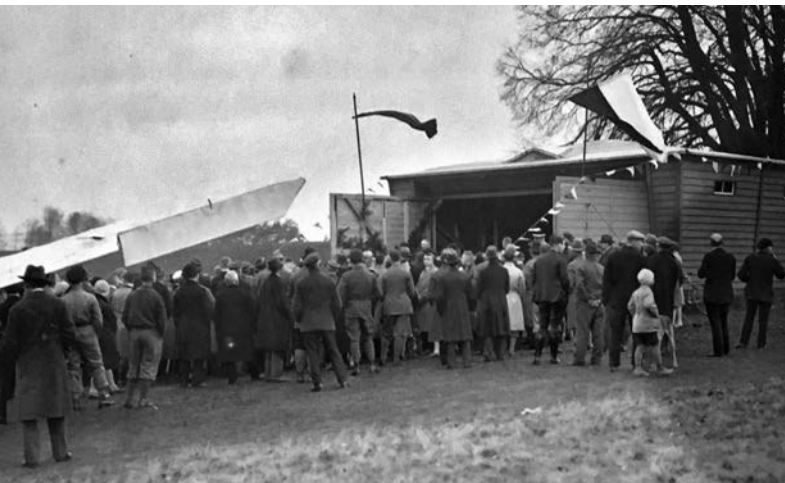
Vor 90 Jahren – im Jahr 1929 – weihte die Marburger Uni einen eigenen Flugzeugschuppen in Cyriaxweimar ein.

Im Vordergrund standen Forschungen zur Höhenfestigkeit. Eine weitere Forschungsfrage galt der Ausbildung des „fliegerischen Gefühls“ im Segelflug und deren Bedeutung für den Motorflug. Die „Anlagen zur Entwicklung des fliegerischen Gefühls“ ließen sich am besten im Segelfluggkurs feststel-