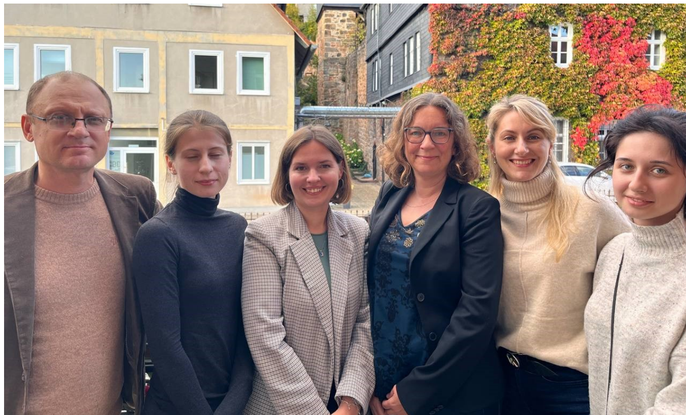
Fünf KollegInnen von der KNEU haben im Oktober Marburg besucht, um die Kooperation weiter zu entwickeln. / Five colleagues from KNEU visited Marburg in October to further develop the cooperation.

In 2024, the project has again been funded by the DAAD as a part of the program „Ukraine digital“ and by the HMWK in the "Brückenprogramm Hessen-Ukraine".